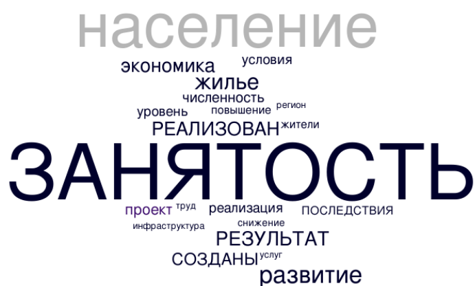
Рис. 3 – Облака слов для конструкции «эффекты» в предобработанных текстах стратегий

Полученные результаты демонстрируют весьма существенную разницу во всех трех исследуемых смысловых конструкциях. Так, на рис. 1 хорошо видно, что в стратегии северных регионов закладываются весьма разнообразные ценности. Можно выделить: жилищное развитие, культура и спорт, доступность обучения, качество государственных услуг, социальное обеспечение семей, развитие труда и доходы населения. То есть можно заключить, что в этом отношении стратегии северных регионов являются сбалансированными и комплексными. Однако вслед за авторами [11] мы должны отметить, что в крайне малой степени в стратегиях проявляются ценности коренных народов Севера.